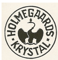
skitse ca 1928 – teksten præget i mat og blankt guld

(har sandsynligvis dannet model for nedenstående røde label med hvidt tryk – ca 1930-35)