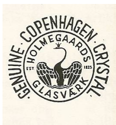
skitse ca 1927 - teksten rød og guld